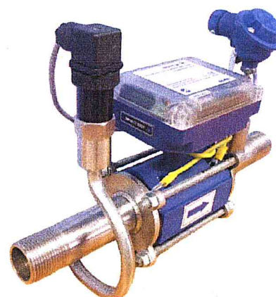
б) вид точки измерения