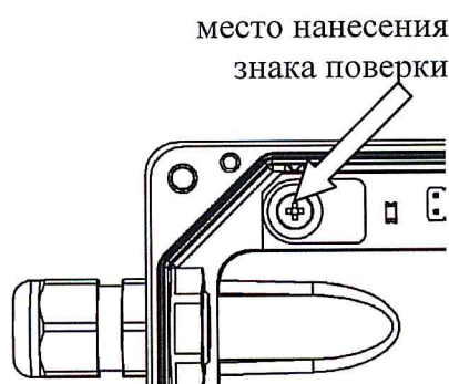
б) преобразователь расхода