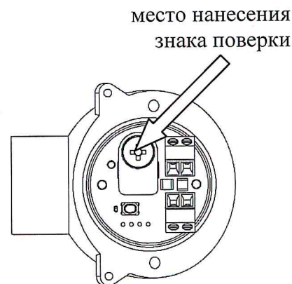
в) преобразователь температуры